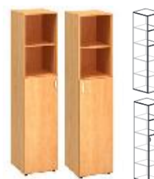
KDND2/1/2-SV4-L KDND2/1/2-SV4-P 400x450x1800mm KDND2/1/2-SV6-L KDND2/1/2-SV6-P 600x450x1800mm