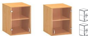
S-NASN6-L S-NASN6-P 600x450x740mm