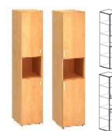
KDD3/2-SV4-L KDD3/2-SV4-P 400x450x1800mm KDD3/2-SV6-L KDD3/2-SV6-P 600x450x1800mm