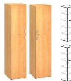
KDS3/2-SV4-L KDS3/2-SV4-P 400x450x1800mm KDS3/2-SV6-L KDS3/2-SV6-P 600x450x1800mm