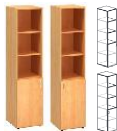
KDN2/1-SS4-L KDN2/1-SS4-P 400x450x1060mm KDN2/1-SS6-L KDN2/1-SS6-P 600x450x1060mm