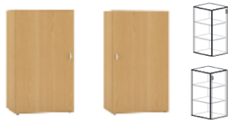
D-SN6-L D-SN6-P 600x450x740mm