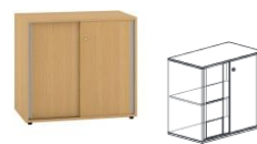
KDN3/2-SV4-L KDN3/2-SV4-P 400x450x1800mm KDN3/2-SV6-L KDN3/2-SV6-P 600x450x1800mm