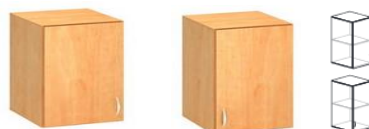
D-NASN6-L D-NASN6-P 600x450x740mm