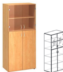
KDNS2/1/2-SV4-L KDNS2/1/2-SV4-P 400x450x1800mm KDNS2/1/2-SV6-L KDNS2/1/2-SV6-P 600x450x1800mm