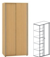
KDN2/3-SV4-L KDN2/3-SV4-P 400x450x1800mm KDN2/3-SV6-L KDN2/3-SV6-P 600x450x1800mm