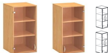
S-NASS6-L S-NASS6-P 600x450x1060mm