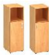
KDD2/3-SV4-L KDD2/3-SV4-P 400x450x1800mm KDD2/3-SV6-L KDD2/3-SV6-P 600x450x1800mm