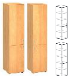
KDS2/3-SV4-L KDS2/3-SV4-P 400x450x1800mm KDS2/3-SV6-L KDS2/3-SV6-P 600x450x1800mm