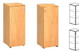
D-SN4-L D-SN4-P 400x450x740mm