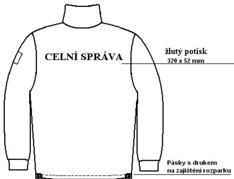
Technický nákres BUNDA R – přední díl a zadní díl