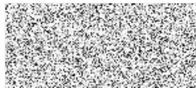
Prodávající předseda představenstva