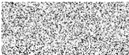
Kupující vedoucí Kanceláře ředitele