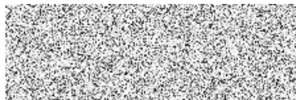
Michal Kříž ředitel odboru 13

Žádáme o zaslání akceptace objednávky, zveřejňované dle zák. č. 340/2015 Sb. (kopie objednávky s razítkem, podpisem a datem akceptace - týká se objednávek nad 50 tis. Kč bez DPH!). Žádáme, abyste při vystavení faktury uvedli i číslo objednávky. Děkujeme