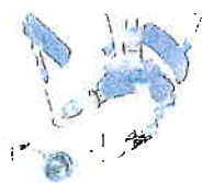
BOA 4-point Retention System with adjustable fit dial