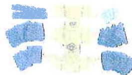
EPIC Pad System Also available in black