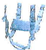
ASPS H-Back available in Black, Tan, Foliage Green or Olive Green

Final retention construction may differ from photos shown.