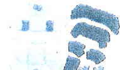
EPIC Air Liner System