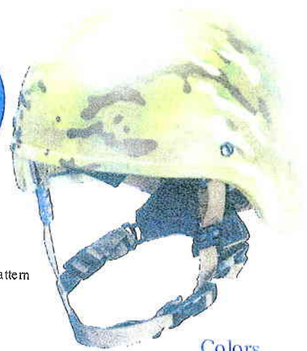
Shown with custom dipped multi-cam pattern and BOA retention