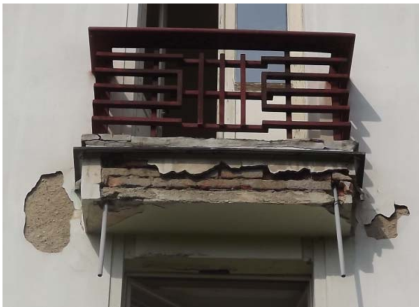
Foto narušených odtoků u balkonů

Foto narušeného balkonu po nevhodné opravě