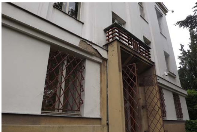
Foto podhledu s prosakující dešťovou vodou